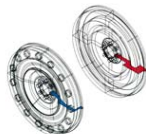
TODA製クロモリフライホイールとSTDフライホイールの解析図