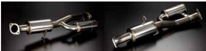
共鳴管(レゾネーター)付き中間サイレンサー

「TODA RACING 2.35L/2.40Lエンジンへの対応品としてリリースされていましたφ70mmマフラーにVer.2仕様が登場しました。フロントパイプへレゾネーターを設置しました。構造上、排気抵抗を増やすことなく低回転で発生するコモリ音を低減しました。(従来のTODA70mmマフラーに上記中間サイレンサーの部分のみの取替えも可能です)リアエンドパイプにチタン材を使用し、サイレンサー オーバーハング部の軽量化、デザインにはストレートテールφ90mmを採用しハードなイメージを演出しました。